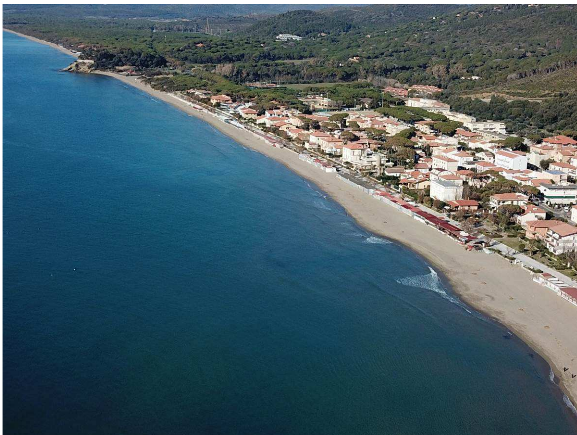
Figura 2. SPIAGGIA SOGGETTA A RIPASCIMENTO

I sedimenti marini saranno inoltre scavati su una barra di sabbia antistante la spiaggia da ripascere, mediante l'utilizzo di una draga aspirante e rifluente con una condotta galleggiante della lunghezza di 250 metri, in modo da poter coprire la distanza di prelievo che è a circa 150-200 metri dalla costa, e poter brandeggiare condotta e draga per una uniformità di prelievo dello spessore di 30 cm e per convogliare a riva una quantità di sabbia non superiore ai 20 mc per metro lineare di spiaggia, come previsto dalle linee guida regionali.